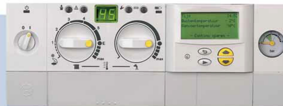
Tekstdisplay Heatronic HR-Top-ketel