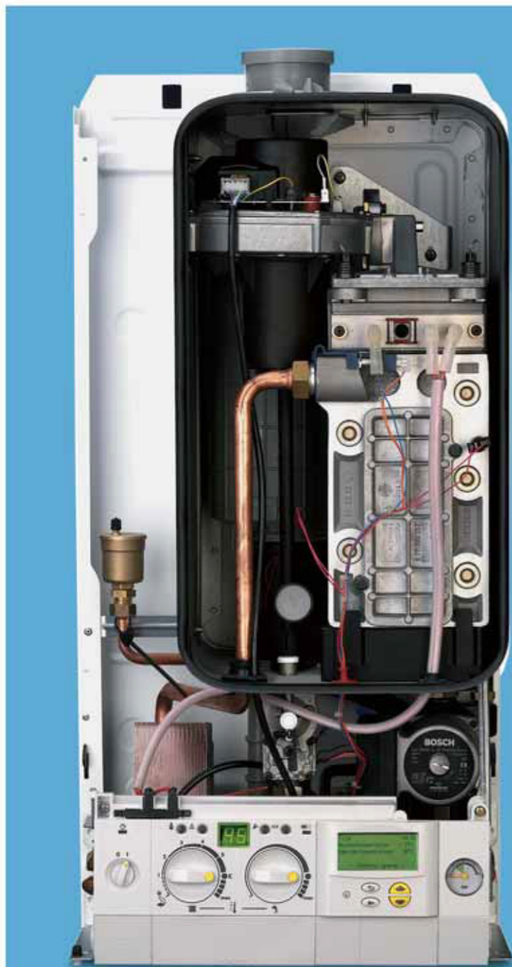
De binnenzijde van de Bosch 35 HRC Top